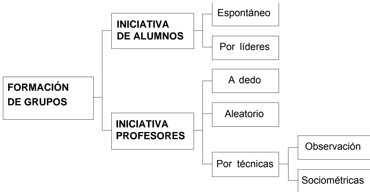
Ilustración 2 Estrategias para formar grupos

En el caso de que sean los profesores los que tomen la iniciativa la designación puede ser simplemente a dedo, de manera aleatoria (por ejemplo, si queremos formar tres grupos, numeraremos 1, 2, 3; 1, 2, 3... toda la lista de la clase para que posteriormente se junten todos los unos, doses y treses) y por último, mediante el test sociométrico teniendo en cuenta los resultados que hayamos obtenido.