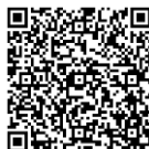
Enlace al vídeo de participación en el concurso